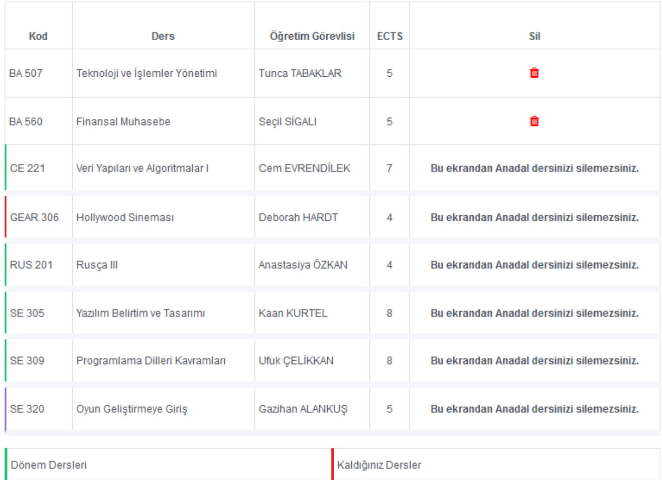
Resim 6 : Kayıtladığınız dersler bölümü