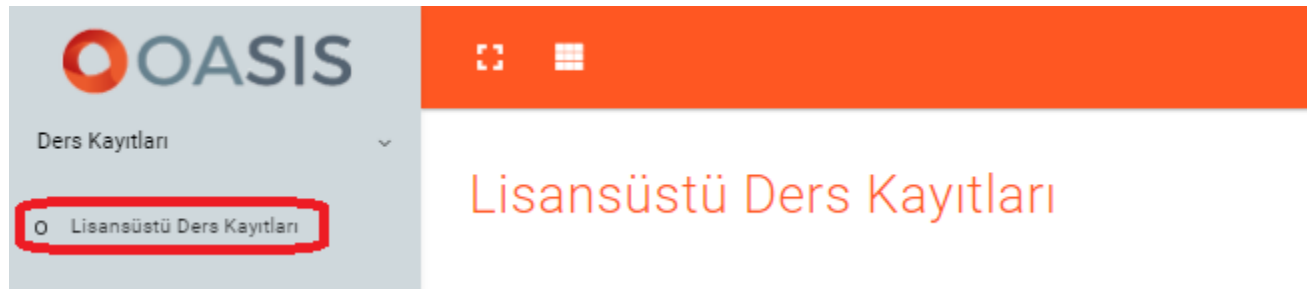
Resim 1: Ders kayıt ekranına giriş

Kullanıcılar sayfaları isterlerse Türkçe ya da İngilizce olarak görüntüleyebilirler.